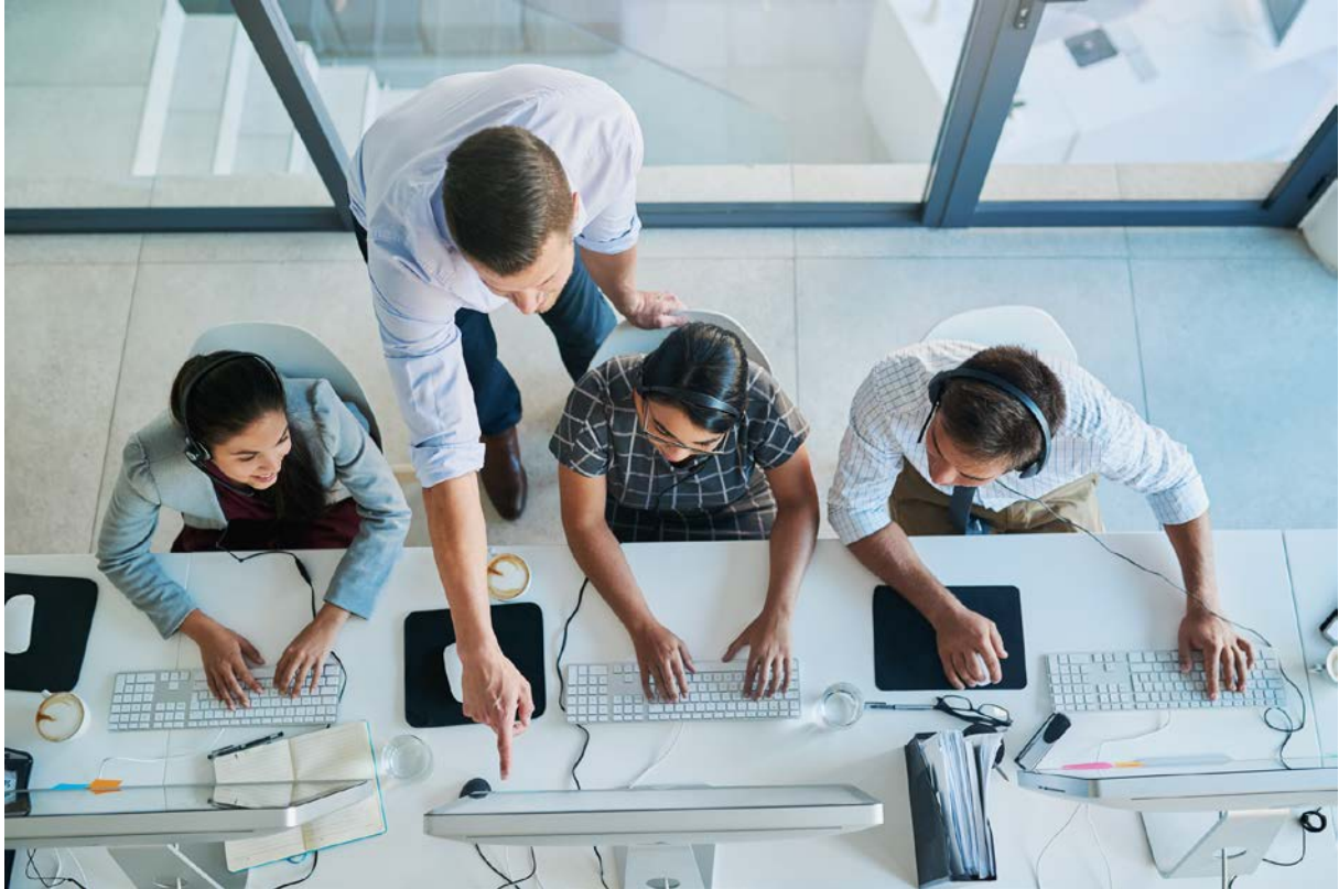
Figure professionali dei Percorsi per le competenze trasversali e per l'orientamento – PCTO